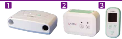
ライトシリーズ超音波センサーセット (税込)